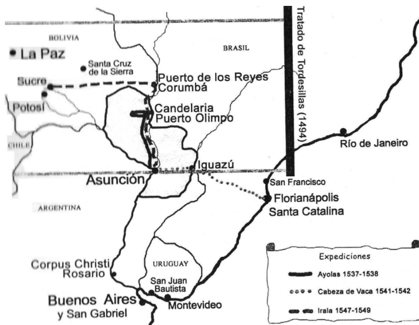
Mapa de las principales expediciones en la Provincia del Río de la Plata y del Paraguay. Sacado de IRALA SOLANO Ramón, Vida y Obra de Domingo de Irala , Asunción, Ediciones y Arte S.A., 2006, p. 216.

http://www.portalguarani.com/737_vicente_pistilli/4825_la_primera_fundacion_de_asuncion_la_gesta_de_don_juan_de_ayolas_1987_obra_de_vicente_pistilli.html